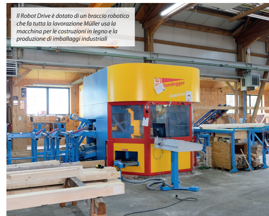
Il Robot Drive è dotato di un braccio robotico che fa tutta la lavorazione Müller usa la macchina per le costruzioni in legno e la produzione di imballaggi industriali